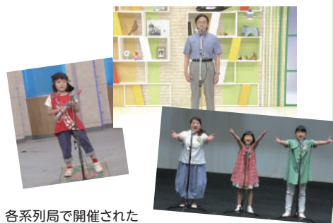
各系列局で開催された 昨年の二次審査収録会の模様