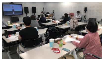
昨年の二次審査風景