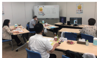
昨年の一次審査風景