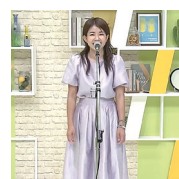
各系列局で開催された 昨年の二次審査収録会の模様

テレビ朝日系列24局のスタジオ等にて行います。詳しい日程はホームページにて発表いたします。