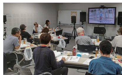
昨年の二次審査風景

『二次審査収録会』の映像をもとにテレビ朝日にて審査を行い、こども、ファミリー、大人の3部門で グランプリ大会 出場者 21組(予定) を選出します。