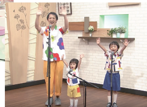
昨年、各系列局で開催された二次審査収録会の模様