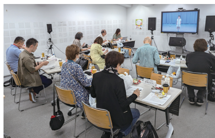
昨年の二次審査風景

『二次審査収録会』の映像をもとにテレビ朝日にて審査を行い、キッズ、こども、大人、ファミリーの4部門でグランプリ大会出場 20組(予定) を選出します。